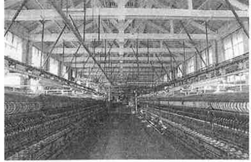
② 富岡製糸場 とみおか