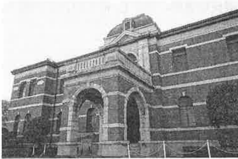
① 官営八幡製鉄所 やはた